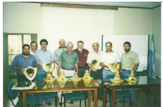
Reconocimiento a ex presidentes del Ciasfe

“El trabajo para poder ser Colegio no fue fácil y no se logró en un día”